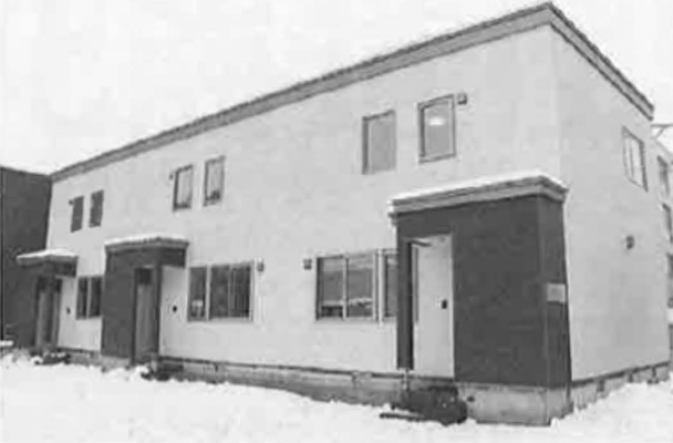
メゾネットタイプのテラスハウスに一新した

同認定は、良質な住宅ストック形成のための市場環境整備促進を目的とした国土交通省の「住宅ストック維持・向上促進事業」での採択を受けて展開。同協議会では「築年数によらない物件の価値を示すことができる」と認定の意義を挙げる。S-COURT IIの場合、認定条件の一つで